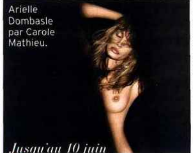
Arielle Dombasle