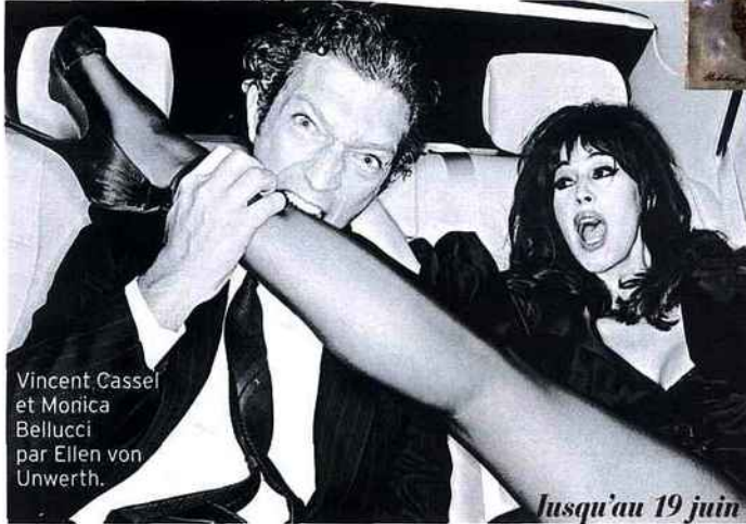
Vincent Cassel et Monica Bellucci